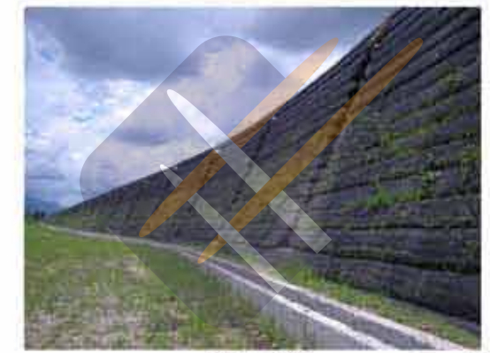
施工後 B 式